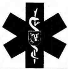
Tabuľka č. 2